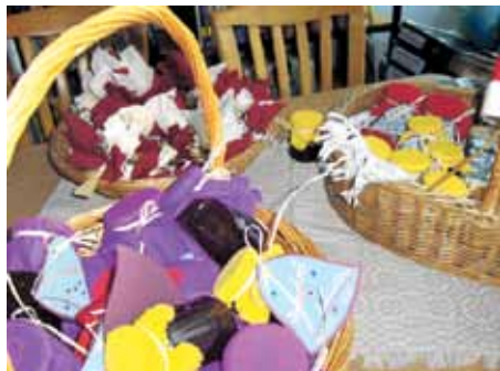
Kopējā darba rezultāts, Ulbrokas bibliotēka 2010. gada 9., 16. decembris