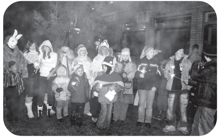
Vienā no ciematiem bērni bija sarūpējuši rūķiem pārsteigumu – viņi izveidoja ansambli un dziedāja dziesmas. Vai jūs zināt kurā ciematā tas bija?