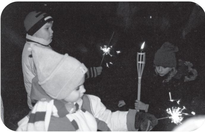
Pat vismazākie Stopiņieši bija atnākuši uz eglīti, dedzināja brīnumsvēcītes un mielojās ar rūķu sarūpētajām piparkūkām