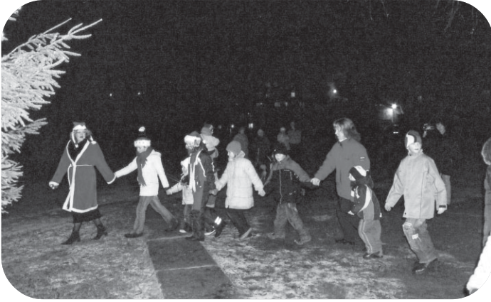
Visi sadevušies rokās kopā ar Ziemassvētku rūķiem iet rotaļās ap eglīti

un lieli, visi bija pulcējušies, lai kopā ar Rūķiem un muzikantiem iedegtu eglītē gaismiņas – Ziemassvētku gaismiņas, kas šajos klusajos un svētajos svētkos mīt ne tikai eglītēs, bet arī mūsu sirsniņās.