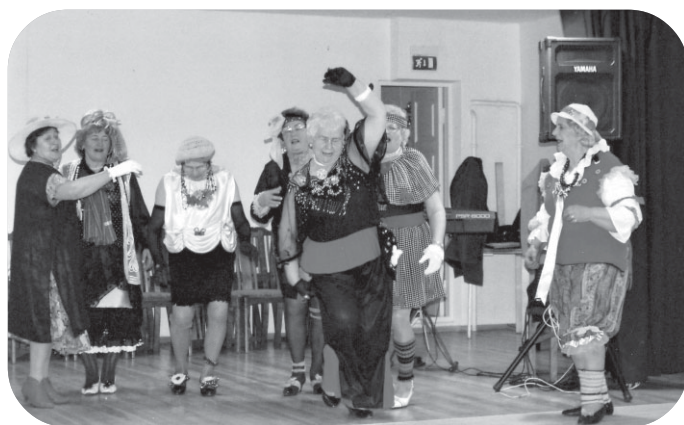
Vokālais ansamblis "Ievzieds" ar dziesmu "Topmodele"