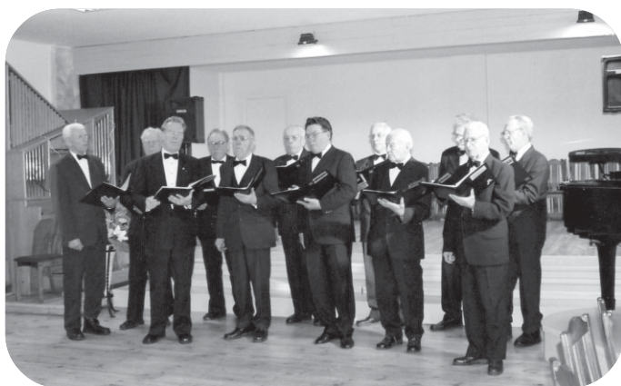
Gulbenes pilsētas kultūras centra vīru vokālais ansamblis "Namejs"

Pēc koncerta visi ķērās pie svētku cienasta, dejām un čibiņu konkursa.