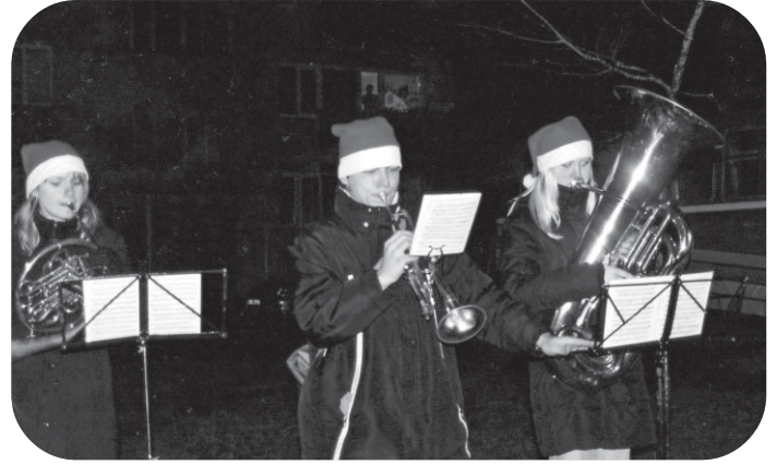
Rūķiem bija līdzī arī rūķu orķestris, kurš spēlēja uz dažādiem mūzikas instrumentiem Ziemassvētku dziesmiņas