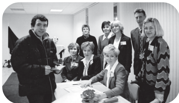
"Pulksten 01.00, vēlēšanu komisija skaita biļetenes. Novērotāji seko vēlēšanu komisijas darbam"

Sauriešu medpunktā tālr. 7956854 Dr.I.Vīksne