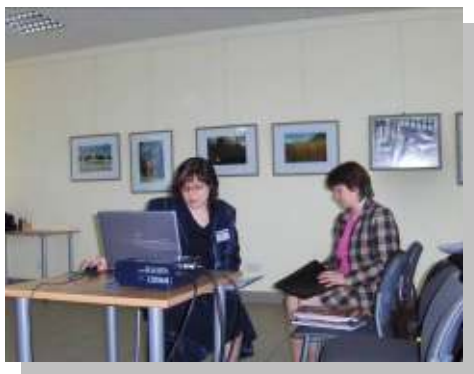
Seminārā Saldus pilsētas bibliotēkā

2009.gadā tika iegūta jauna pieredze sadarbībai ar cita rajona bibliotēku. Saldus pilsētas bibliotēka sava rajona pašvaldību bibliotēku darbinieku seminārā uzaicināja dalīties informācijā par bibliotēku darbu Grieķijā, šis valsts kultūrvēsturiskajām vērtībām. Pēc semināra kopā ar Ulbrokas bibliotēkas vadītāju apmeklējām Blīdenes pagasta bibliotēku