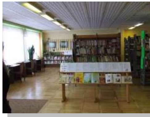
Blīdenes pagasta bibliotēka