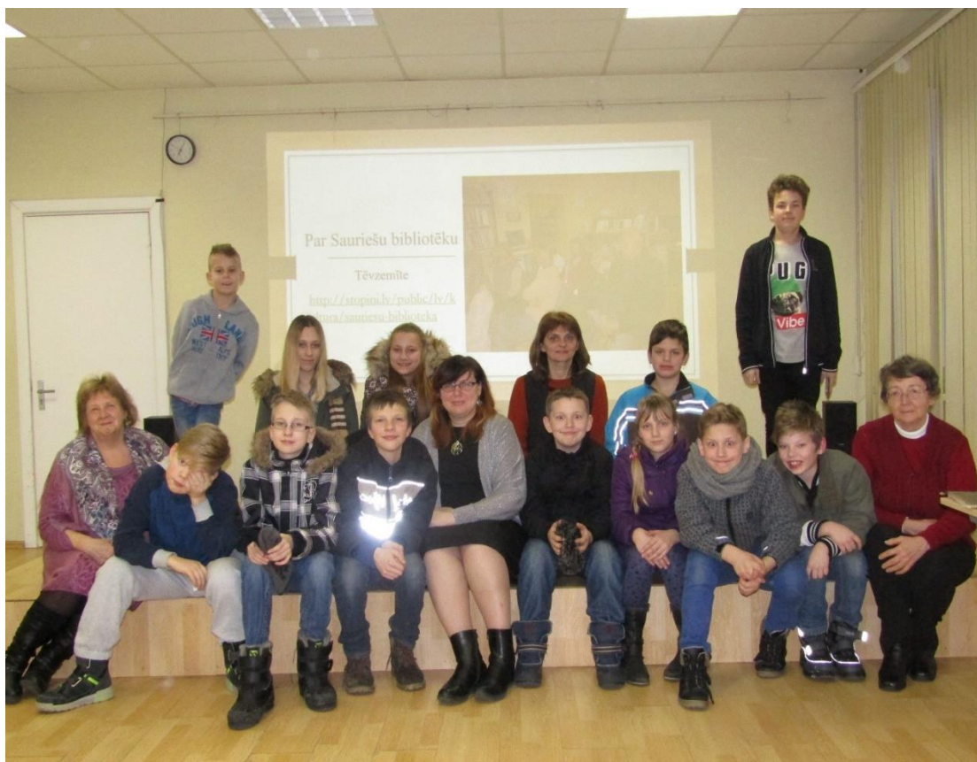
Čaklākie Upesleju lasītāji pēc Sauriešu bibliotēkas izstādes

Bibliotēkas darbinieces veikušas lielu izpētes darbu, lai savus lasītājus varētu iepazīstināt ar tik bagātīgiem vēstures materiāliem. Bet vēl ir daudz nezināmā. Iesāktais darbs jāturpina kopīgiem spēkiem. Iespējams, kādam no vecākās paaudzes novadniekiem ir atmiņas, dzirdēti stāsti vai fakti par Sauriešu bibliotēkas darbību vairākus gadu desmitus atpakaļ. Lai sadarbība turpinātos, bibliotēkas vadītāja pasniedza simbolisku dāvanu – sveci dzijas kamoliņa veidā. Turpināsim ritināt atmiņu kamolīti kopā!