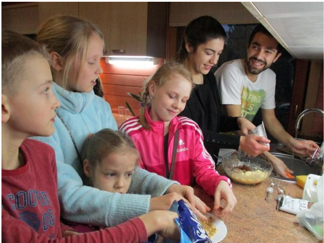
Dienas centrā Līči bērni dienā pirms Mātes dienas veidojām skaistus apsveikumus mīļajām māmiņām. Pārrunājām ģimenes vērtības, Mātes dienas vēsturi un tradīcijas.