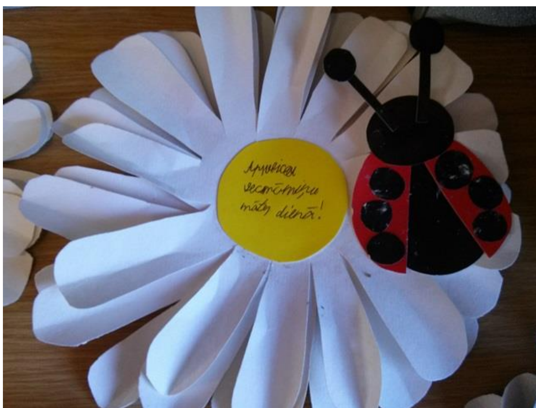
15.maijā viesos ar brīnišķīgu koncertu bija akordeonistu ansamblis "Akcents".